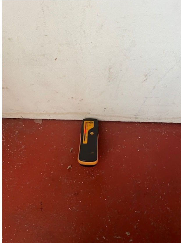
Fuktmätning i utreglad vägg i källaren.